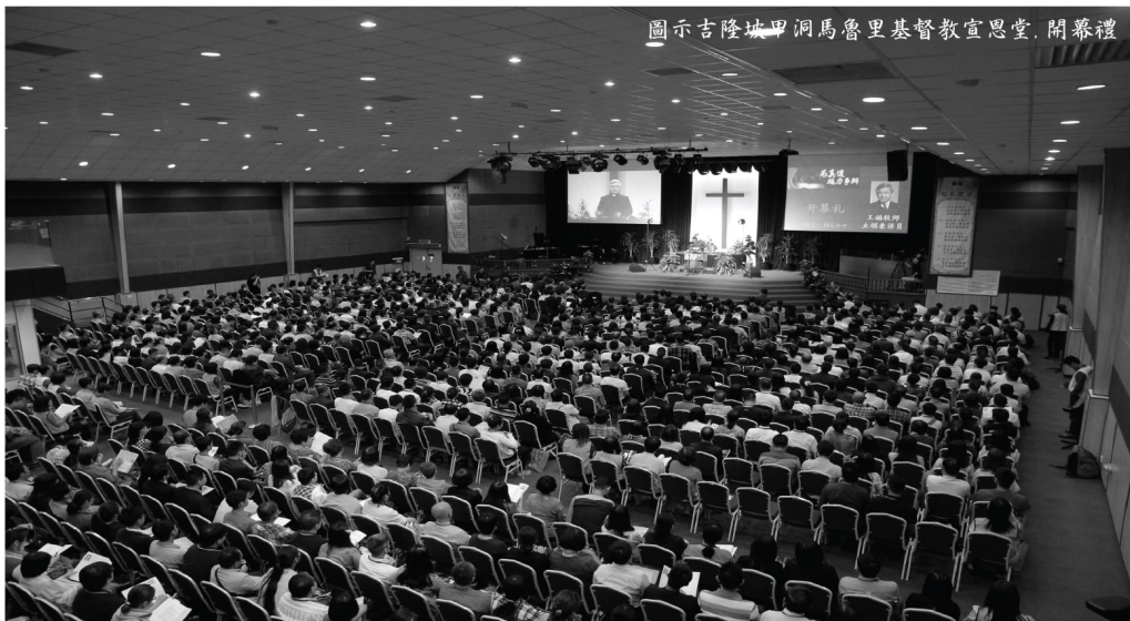
圖示吉隆坡甲洞馬魯里基督教宣道堂開幕禮