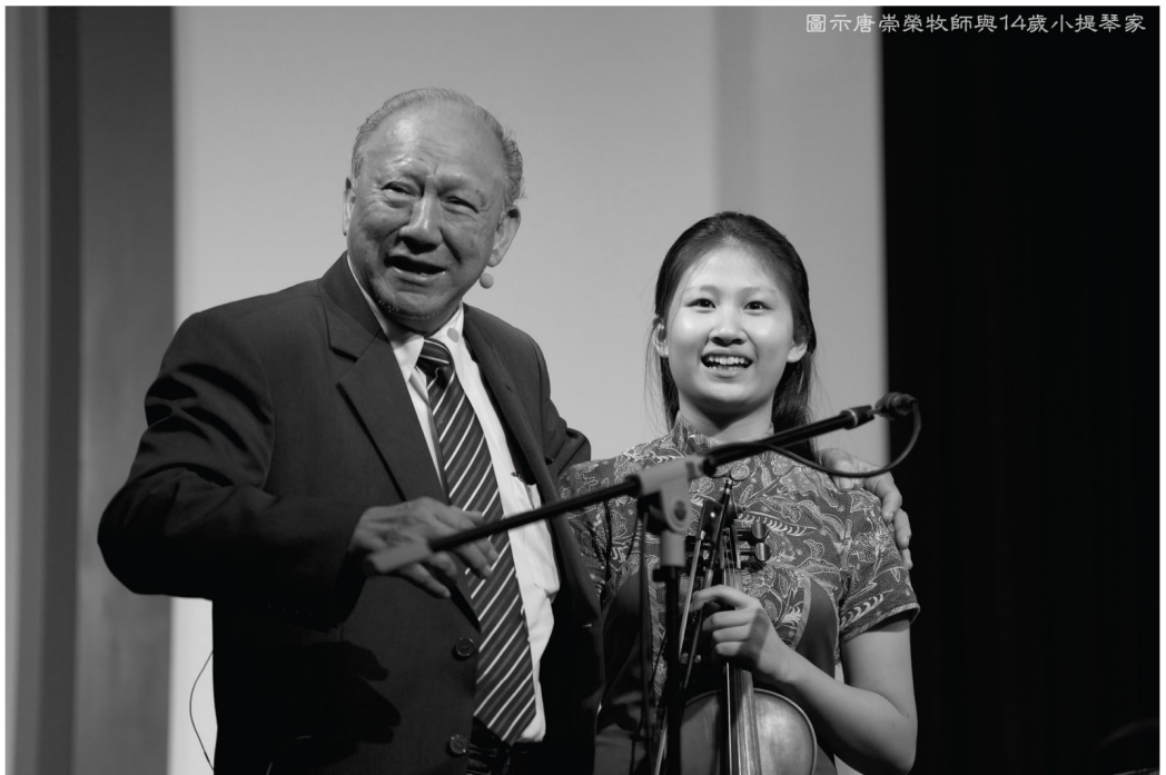
圖示唐崇榮牧師與14歲小提琴家

向社會，我們更不能忘記我們的責任在見證基督的福音。我們花多少時間在神學院圍牆，教堂座椅，網路論壇，又花多少時間比例在迷失的羊群中舉燈尋找，在發白的莊稼中收割？歸正福音運動不是可有可無，而是緊急歸回基督福音信仰與福音使命的運動。上帝藉著他的僕人唐崇榮牧師向時代發出的呼籲，求主繼續給我們恩典和機會在其中學習，勇敢委身在這個爭戰性的運動中。